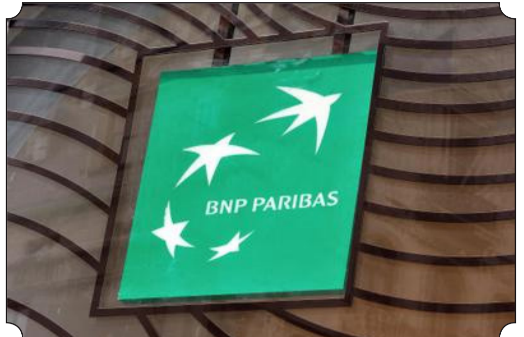
• BNP Paribas fait partie de cette coalition de banques s'engageant à la neutralité carbone pour 2050.

Le secteur de la finance compte lui aussi s'engager pour le climat. 43 banques internationales veulent arriver à la neutralité carbone d'ici à 2050.