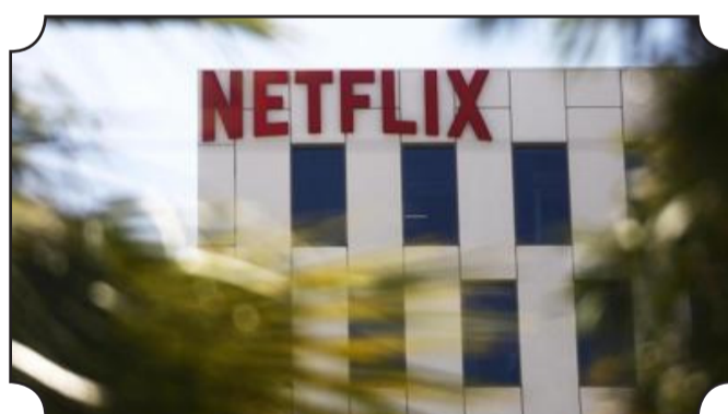
• Netflix ne table que sur 1 million d'abonnés supplémentaires pour le trimestre en cours, contre 10 millions l'année dernière à la même période.

Les Bridgerton et les Lupin n'ont pas sauvé la mise à Netflix, qui a vu la croissance de sa base d'abonnés payants ralentir au premier trimestre, un signe que la période propice de la pandémie s'achève peut-être pour certaines plateformes numériques. Netflix a fini le premier trimestre 2021 avec près de 208 millions d'abonnés payants dans le monde (+14%), soit 2 millions de moins que ce que le géant du streaming vidéo avait promis aux investisseurs. La sanction a été immédiate: son titre perdait plus de 10% lors des échanges électroniques après la clôture de la Bourse. «Nous pensons que la croissance de notre base d'abonnés payants a ralenti à cause de la percée de 2020 liée au Covid-19 et aussi à cause d'une offre de contenus plus réduite au premier semestre de cette année, en raison des délais de production dus à la pandémie», a expliqué le groupe californien dans un communiqué.