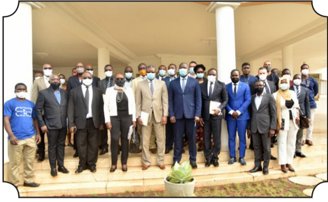
● Les membres du Comité de pilotage

Le Comité de pilotage du Haut conseil pour l'emploi des jeunes (HCEJ), après la première session inaugurale qui s'est tenue le 13 avril dernier a fait le point de la cérémonie ce 21 avril 2021.