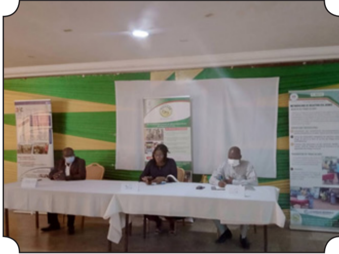
● Le présidium à l'ouverture des travaux

Du 15 au 17 avril 2021, l'Agence nationale d'appui au développement à la base (Anadeb), a de nouveau tenu avec ses partenaires et les parties prenantes à Dapaong dans la région des savanes, un atelier bilan du trimestre 1 du projet d'opportunités d'emploi pour les jeunes vulnérables (EJV). Ladite rencontre a permis à l'institution de faire le point avec ses siens des réalisations du projet dans chaque région ainsi que les visites de terrain afin de constater les réalisations du projet en cours. Le projet se veut ainsi pour l'Anadeb une réussite dans les cinq régions du pays surtout dans la région des plateaux. En termes d'avancées, les résultats produits par l'Anadeb en disent long, l'initiative à travers sa sous-composante, volontariat communautaire et formation dont l'objectif est « d'offrir l'occasion de développer de saines habitudes de travail et d'acquérir des valeurs civiques tout en participant à une activité valorisée par la communauté », a permis d'enregistrer pour l'année 2020 « 41 microprojets des Travaux de haute intensité de main d'œuvre (THIMO) ». Pour cette année 6 de ce projet ont été renforcés pour une utilisation plus efficace. Au-delà, la sous-composante Formation sur les aptitudes à la vie quotidienne et micro entrepreneuriale quant à elle a permis de former « 786 jeunes dans la région des plateaux sur la santé, le genre et la diversité, les services communautaires, la sécurité sur le lieu de travail ». Cette formation, organisée en 22