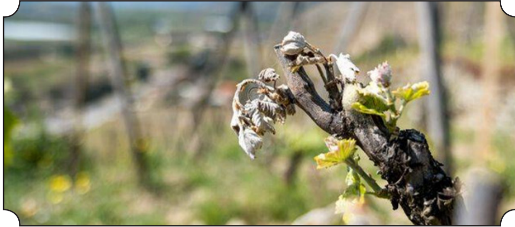
• A cause de l'épisode de gel d'avril, les récoltes de vin français pourraient baisser en moyenne de 12,5 à 15 millions d'hectolitres, selon le secteur.

L'épisode de gel exceptionnel qui a sévi sur la France en avril pourrait bien avoir un impact désastreux sur le secteur. Selon l'organisme public FranceAgriMer, les récoltes de vin 2021 pourraient diminuer d'environ 28 % à 30 % par rapport à la moyenne des cinq dernières années.